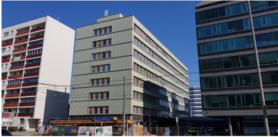
Sanierung Bürogebäude in 1020 Wien: Bauphysikalische Bearbeitung