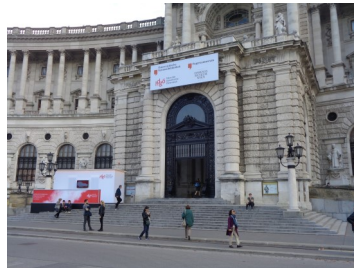
Haus der Geschichte (Hofburg): statisch-konstruktive Beratung