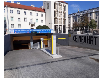
Tiefgarage Pius-Parsch-Platz in 1210 Wien: Generalplanung Tiefgarage