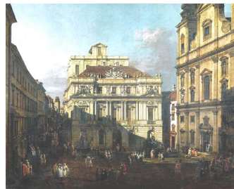
Österreichische Akademie der Wissenschaften: Brandschutzkonzept, Tragwerksplanung