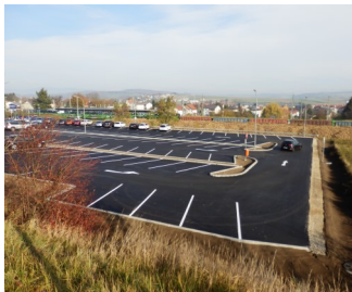
Park&Ride-Anlage Loosdorf: Detailplanung und ÖBA