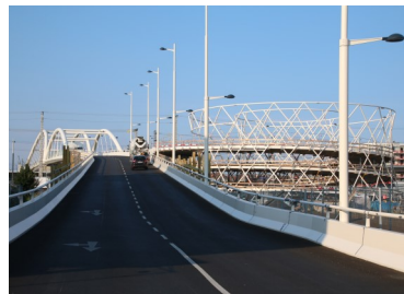
Südbahnhofbrücke in Wien: Planung, Baubegleitung