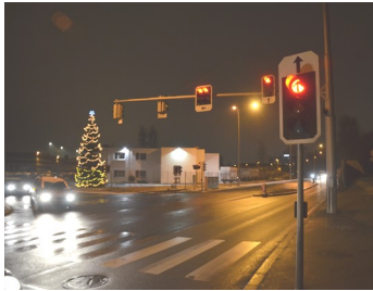
Planung und Evaluierung von Verkehrssignalanlagen (VLSA)