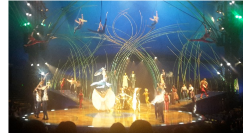
Cirque du Soleil, Gastspiel „Amaluna“: Schalltechnische Untersuchung