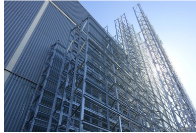
Hochregallager Fa. NEFF in Bretten: Tragwerksplanung