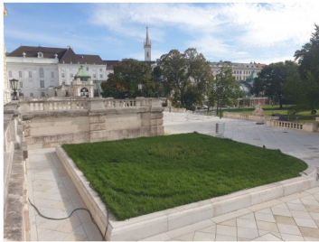
1010 Wien, Burggarten: Sanierung Oberfläche Tiefspeicher, Generalplanung