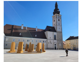
3100 St. Pölten, Neugestaltung Domplatz: Straßenplanung, statisch-konstruktive Bearbeitungen, diverse Abnahmen