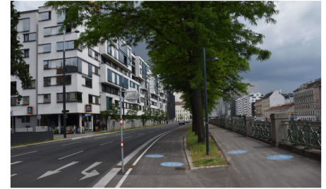
1150 Wien, Linke Wienzeile: Verkehrsplanung für die Garage des Wohngebäudes Nr. 280, Straßenplanung