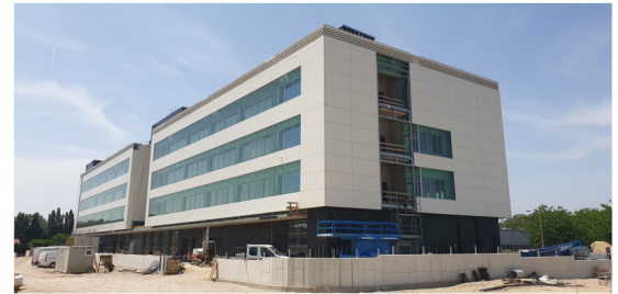
1220 Wien, Neubau ÖBB Betriebsführungszentrale Wien Ost 2: Bauphysikalische Bearbeitung, Brandschutzplanung