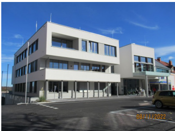
4860 Lenzing, Neubau Dienstleistungszentrum: Bauphysikalische Bearbeitung, Brandschutzplanung