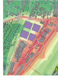
1220 Wien, Breitenleer Straße: UVP-Feststellungsantrag Luft/Lärm/Verkehr