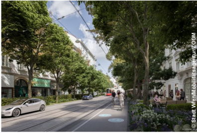
1040 Wien, Wiedner Hauptstraße: Straßenplanung