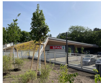
1140 Wien, Hüttelbergstraße, Infrastrukturgebäude: statisch-konstruktive Einreichplanung, Ausführungsplanung, Prüflingenieur