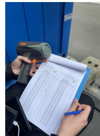
Mehrere Straßen in Wien: Messung Geschwindigkeitsverhalten von Radfahrern samt Verkehrserhebungen